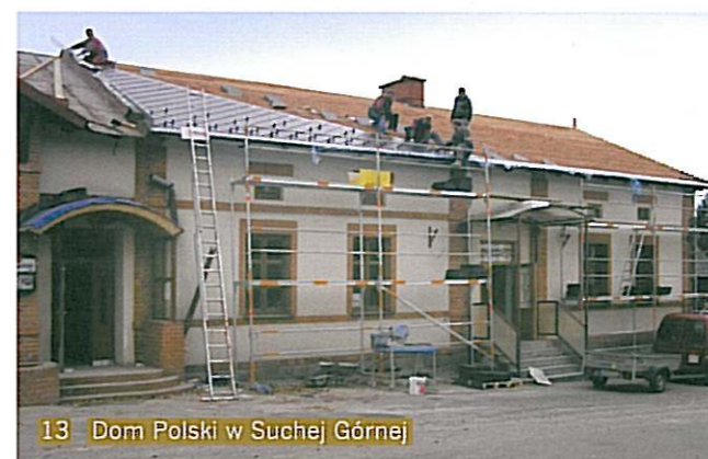
13 Dom Polski w Suchej Górnej

Burgas – Senat wsparł roboty budowlano-instalacyjne w nowo budowanej siedzibie Polskiego Stowarzyszenia Kulturalno-Oświatowego. Oddział tego stowarzyszenia istnieje w Burgas od 1985 r., od 25 lat działa niedzielna szkółka języka polskiego, do której uczęszcza 25 dzieci.