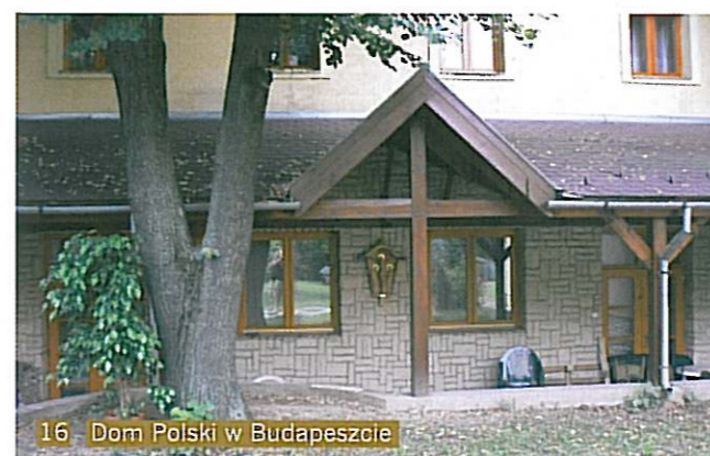
16 Dom Polski w Budapeszcie