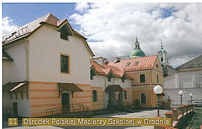
11 Ośrodek Polskiej Macierzy Szkolnej w Grodnie