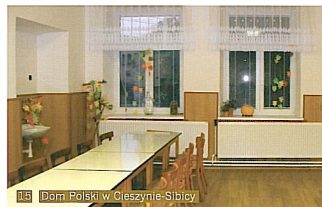
15 Dom Polski w Cieszynie-Sibicy