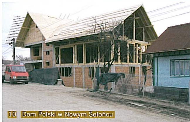
10 Dom Polski w Nowym Sokołcu