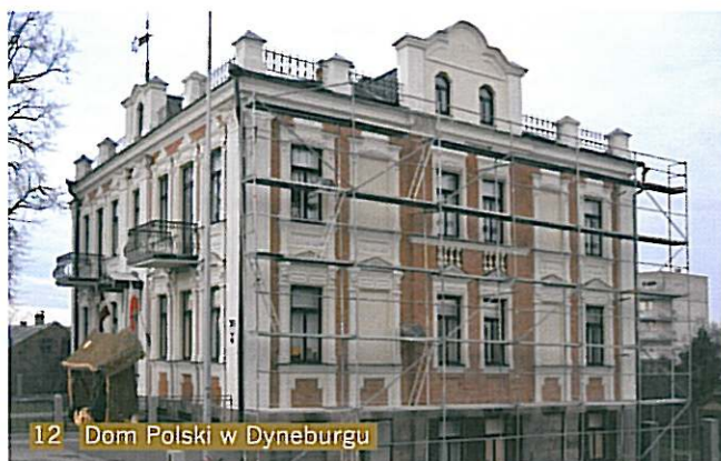
12 Dom Polski w Dyneburgu