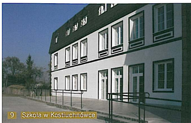
9 Szkoła w Kostuchnowce